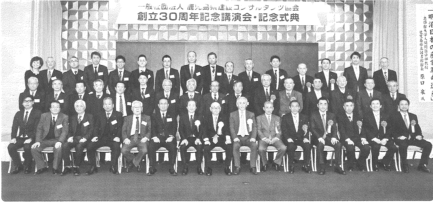
一般社団法人 鹿児島県建設コンサルタント協会 創立30周年記念講演会・記念式典