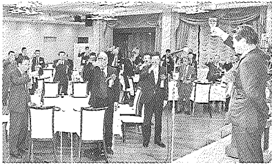
多くの来賓を招き開かれた 祝賀会