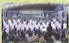
NHK鹿児島児童合唱団