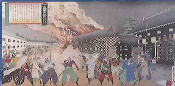
薩摩屋敷焼討之図