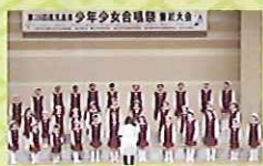
霧島市少年少女合唱団